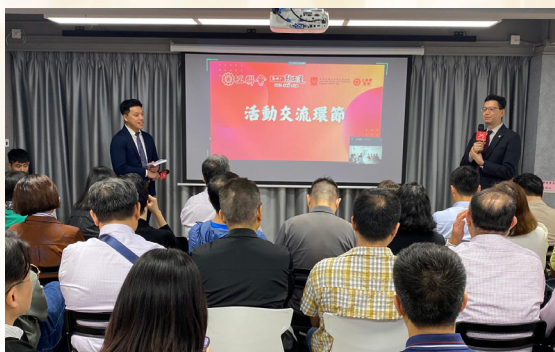
活動交流環節工聯會吳秋北會長與參加者進行交流與學習